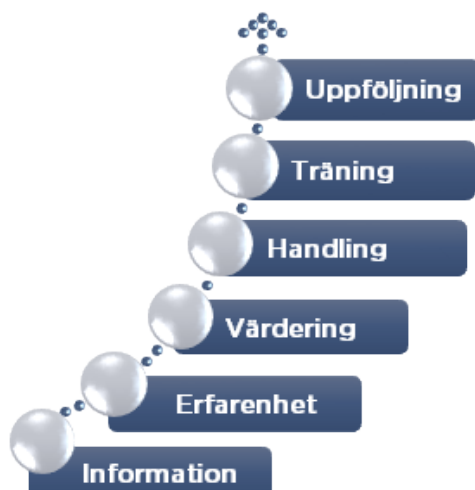
Trappmodellen för informationsöverföring och bearbetning av värderingar och attityder

Vi håller både öppna och företagsinterna utbildningar. Kunskap är grunden till faktabaserade beslut och en förutsättning för att skapa engagemang hos ledning och personal. Kunskap är en del i våra metoder för att ändra beteende. Det räcker ofta inte med att bara tillföra information för att få människor att handla annorlunda.